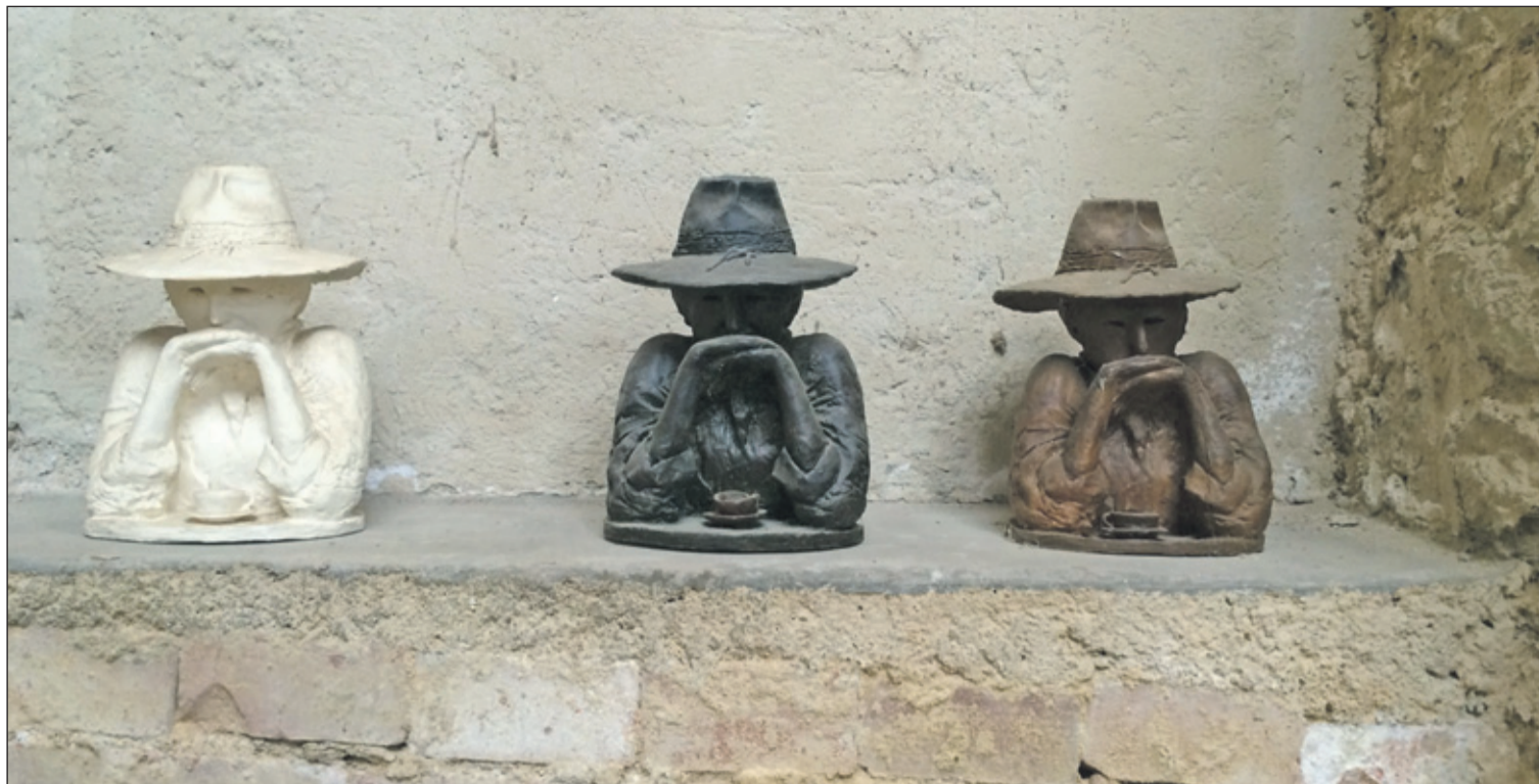
Boeli van Leeuwen in drievoud, brons, Cornelis Zitman.