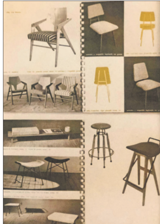
Foto van een blad met meubels naar ontwerp van Zitman uit de catalogus van Tecoteca, zijn meubelfabriek in Caracas.