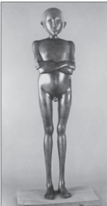
Naakte jongen, brons, 1973, uit het boek 'Onze man in Caracas, en in bezit van Museum Beelden aan Zee.