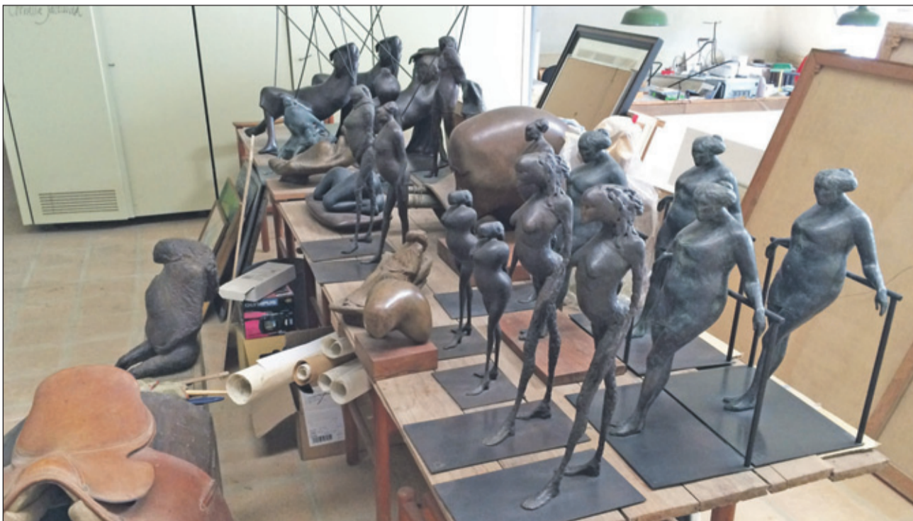
Beeld uit 2014 van El Trapiche met onder andere een aantal Cumanesa's.

de Venezolaanse president. In Spanje krijgt Zitman vaste grond onder de voet in 2008 en wel in la Casa Museo de Venezuela in Beas met de expositie 'Zitman y su tribu' en in het museum van Huelva. In de drie opvolgende jaren verovert Zitman ook de plaatsen Sevilla, Cadiz, Almonte, Granada, Córdoba, Jaén en Almería. Op de Plaza España in Beas komt zijn Don Quichot